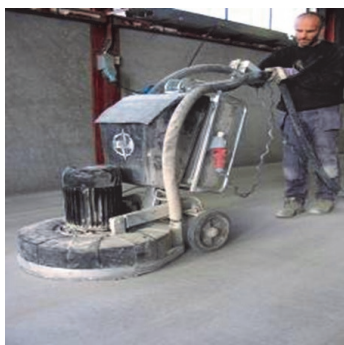
Obr.1 Podklad připravit předepsaným způsobem.