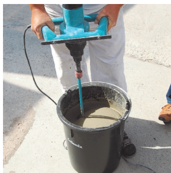
Obr.3 Namíchání materiálu pomocí míchadla m-tec duo-mixu nebo za síla pomocí m-tec SMP PU.