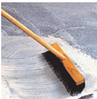
Obr.2 Podklad zpenetrovat předepsanou penetrací.